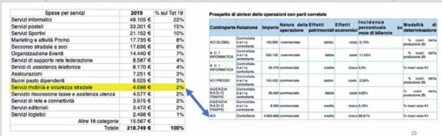
Figura 4: Spese per servizi ACI 2019 e Prospetto operazioni con parti correlate Infomobility 2019

Allora ricapitolando l'ACI (Ente pubblico non economico), con i denari che provengono dai cittadini (circa mezzo miliardo di Euro in 5 anni) principalmente attraverso i PRA: