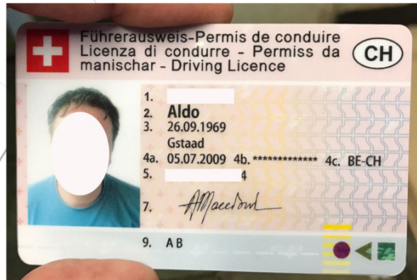
La nuova patente di "Aldo"