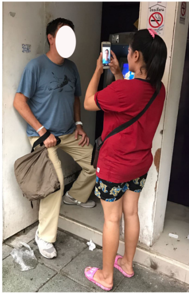
La foto tessera

... quindi è possibile diventare titolare di una patente di guida, o di qualsiasi documento, di un altro Paese? Sembra di sì! Basta solo scegliere dal catalogo che è lì in bella mostra... Non avete una foto? ...e che problema c'è? ...nei venti Euro è inclusa anche l'effigie del vostro volto che sarà poi stampata sulla patente... basta un muro a sfondo più o meno bianco, ed il cellulare della bella e giovane donna dagli occhi a mandorla e dal sorriso smagliante che è lì pronta ad immortalarvi. Stupefacente, poi, la compilazione dei dati del titolare o pseudo tale. Come in un film, potete decidere all'istante di chiamarvi come il vostro attore/attrice preferito... nessuno chiede niente, nessuno vuol sapere nulla... basta compilare un apposito form lì per strada e pagare i venti Euro richiesti, forse pochi spiccioli per noi, ma che al cambio in valuta locale corrispondono all'incirca a 775,00 Bath, tutto sommato una bella cifra se si considera che uno stipendio medio nella capitale thailandese può oscillare tra gli 8 ed i 10mila Bath.