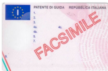
Patente di guida