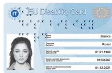
Carta europea della disabilità

I dati e i documenti necessari all'Istituto Poligrafico e Zecca dello Stato S.p.A. per la generazione delle versioni digitali della patente di guida mobile e della Carta europea della disabilità sono resi disponibili, per il tramite della Piattaforma Digitale Nazionale Dati (PDND) di cui al citato articolo