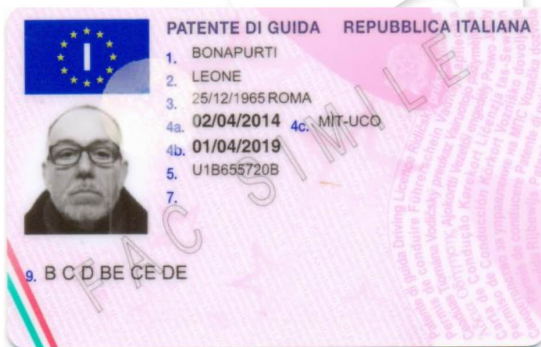
patente di guida MC 720 P (recto)

Per quanto di specifico interesse, relativamente alle questioni legate all'ambito del controllo documentale stradale e dell'identificazione delle persone, significativa rilevanza assume nell'ordinamento nazionale l'introduzione della patente di guida mobile , di cui al momento di andare in stampa - per ovvie ragioni di riservatezza - non è possibile dare alcuna anticipazione rispetto all'aspetto grafico. Ciò che è possibile rivelare è che si tratterà della versione digitale (o dematerializzata) della patente di guida fisica di cui è titolare un conducente residente in Italia ai sensi dell'articolo 118-bis ( requisito della residenza normale per il rilascio della patente di guida e delle abilitazioni professionali ) C.d.S.