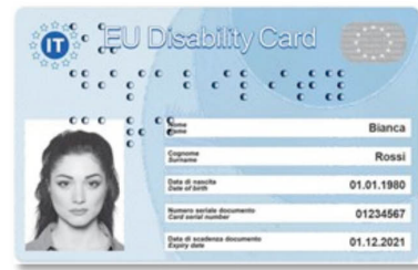
Carta europea della disabilità

I dati e i documenti necessari all'Istituto Poligrafico e Zecca dello Stato S.p.A. per la generazione delle versioni digitali della patente di guida mobile e della Carta europea della disabilità sono resi disponibili, per il tramite della Piattaforma Digitale Nazionale Dati (PDND) di cui al citato articolo art.50-ter, rispettivamente, dal Ministero delle infrastrutture e trasporti e dall'Istituto nazionale di previdenza sociale (INPS).