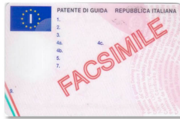
Patente di guida